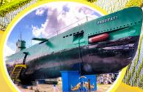
นั่งรถไฟสูง..สุราบาย่า