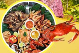
ซีฟู้ดหาดจิมบาร์ัน

ยอดยาคาร์ตา บุโรพุทโธ สุราบาย่า โบรโม บาหลี่ 8วัน 7คืน