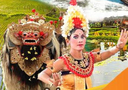
ชมการแสดงบารองด้านซ์